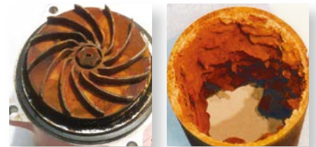
Korrosionsschäden in Rohren und Heizkörpern

Eine verlässliche Wasserqualität in HLK-Systemen unterstützt einen störungsfreien Betrieb. Je weniger Fremdstoffe (Luft und Schmutz) sich im Wasserkreislauf befinden, desto stabiler ist die Wärme- bzw. Kälteverteilung. Die Anfälligkeit auf Korrosion und defekte Komponenten im System wird dabei minimiert. Mit der Zeparo Abscheidetechnologie können Strömungsgeräusche, gluckerende Heizkörper, verminderte Heizleistung, blockierte Armaturen, Regelventile und Pumpen oder gar Leckagen vermieden werden.