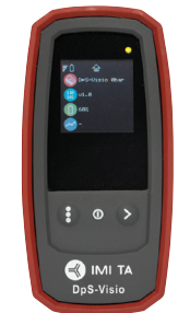
DpS-Visio 08.2017 -