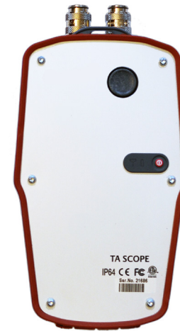
DpS - 07.2017