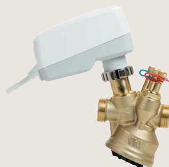
TA-Slider & TA-Modulator, pohon a kombinovaný ventil

Zajistěte požadovanou a stabilní pokojovou teplotu, která obyvatelům přinese kýžený komfort při minimální možné spotřebě energie.