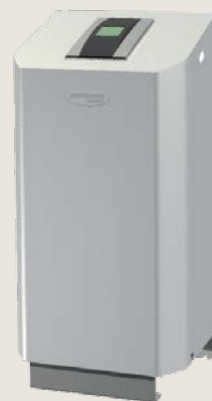
Odplyňovací zařízení Vento Connect

Hluk v soustavě je pro nájemníky opravdu nepříjemný, ale lze se mu snadno vyhnout. Odstraněním vzduchu, cirkulujícího v soustavě, zamezíte hlučnosti a zabráníte tvorbě nečistot, které ohrožují výkon celé soustavy.